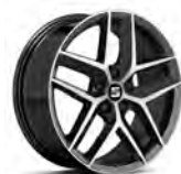
18 inch Performance Piano Black (PUK)