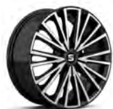
17 inch Dynamic Piano Black (PUA-2)