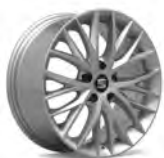
17 inch Dynamic Brilliant Silver (PUB)