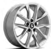
18 inch Performance Brilliant Silver (PUM)