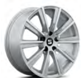
18 inch Cup Racer zilver (5FOCON498C 1BC)