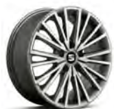
17 inch Dynamic Piano Black (PUA-1)