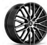
19 inch Performance Piano Black (RL6)