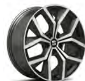
18 inch Performance XPR Piano Black (PUL)