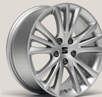
Dynamic St PUA