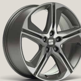
Performance 2 FR PUN