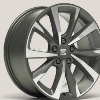
Performance FR PUK