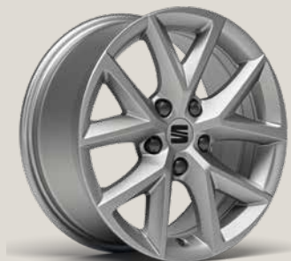
Urban R St