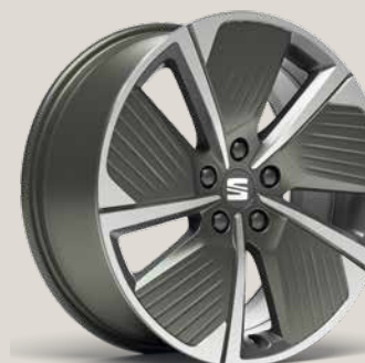
Performance Aero FR P8R

Reference R Style (Launch Edition) St FR (Launch Edition) FR